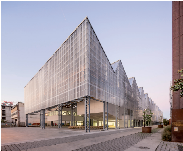
à gauche: Beaux-Arts Nantes Saint-Nazaire. Architecture Franklin Azzi. Photo Luc Boegly. à droite: Vues des ateliers. Photo Mai Tran