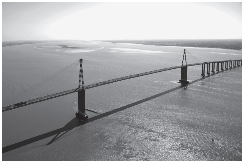
Pont de Saint-Nazaire