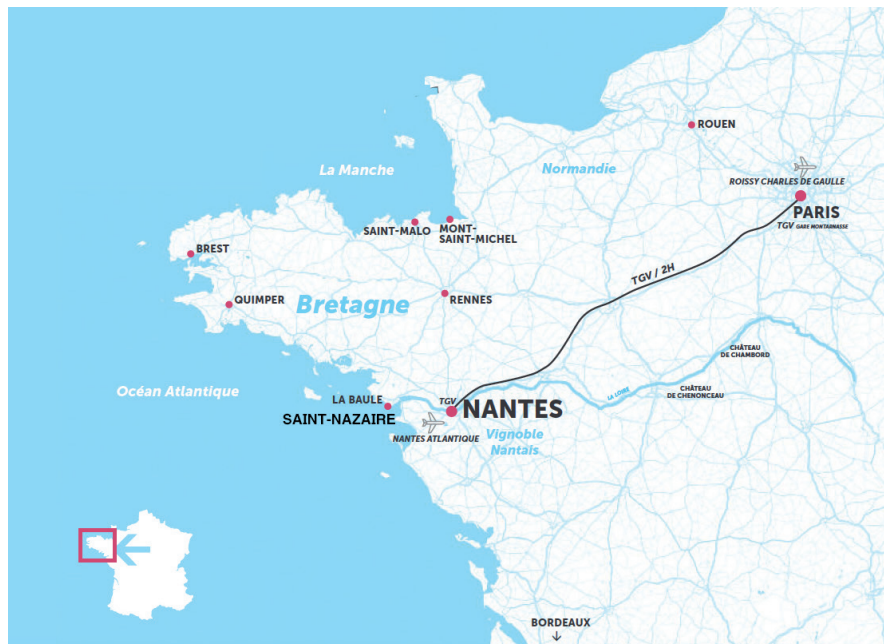
Anima Productions / Le Voyage à Nantes