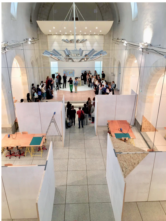
Rentrée des Ateliers de l'Estuaire 2019. Chapelle des Franciscains, Saint-Nazaire.